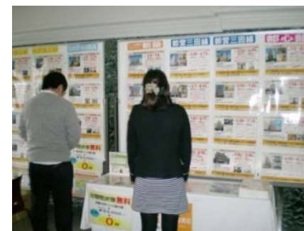
■ひとり暮らし相談会イメージ